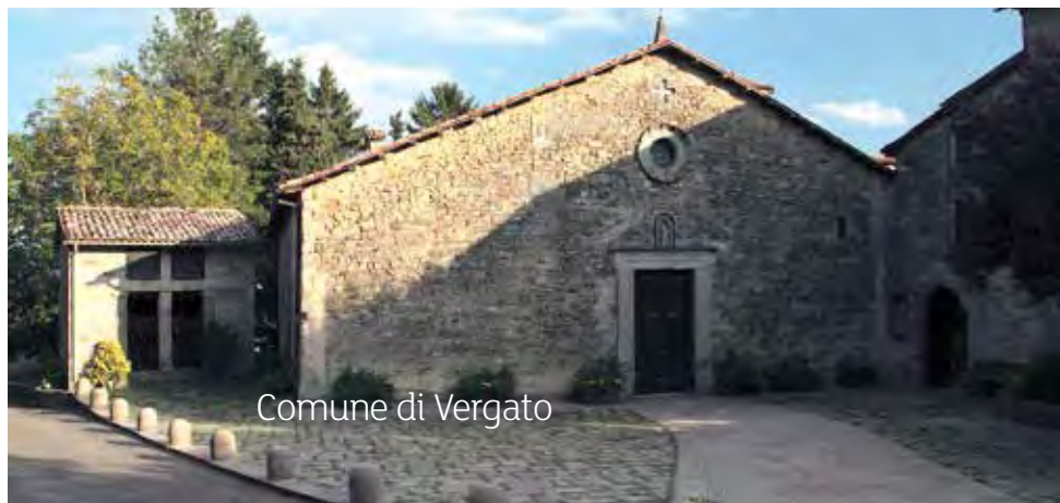
Comune di Vergato