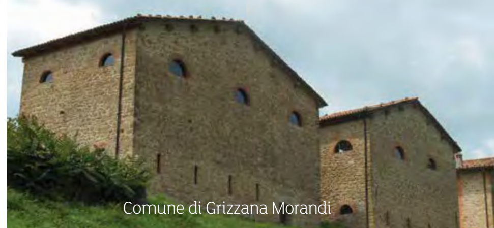
Comune di Grizzana Morandi

Venerdì 11 Sabato 12 Domenica 13 Marzabotto, Parco Peppino Impastato Festival storico di Kainua