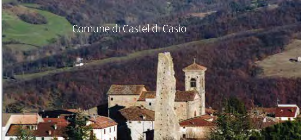
Comune di Castel di Casio