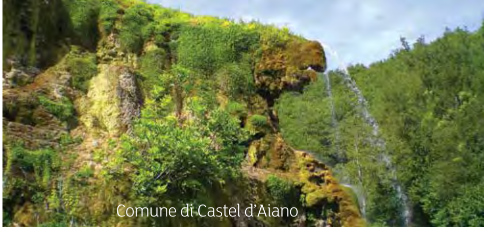
Comune di Castel d'Aiano