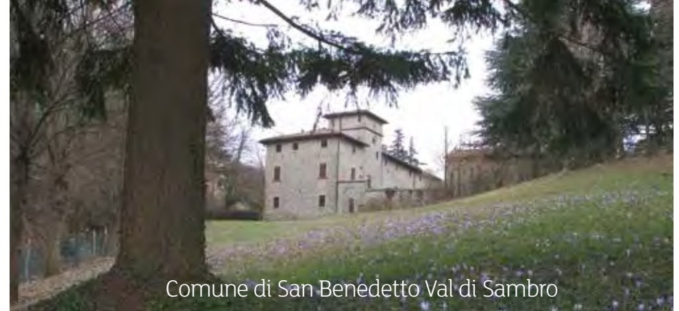
Comune di San Benedetto Val di Sambro